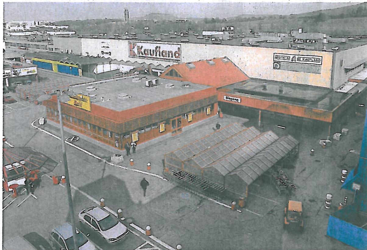
Die unscheinbare Gasse zwischen dem Parkhaus ganz rechts im Bild und dem bisherigen Eingangsbereich soll zu einer neuen Ladenpassage werden, über die auch die Anbindung des Einkaufszentrums an die Stadtbahn geplant ist.

An der Aufwertung des einstigen Premiumstandorts arbeitet Kaufland seit geraumer Zeit. Die grundlegende Neugestaltung des Einkaufszentrums steht im Zusammenhang mit der geplanten Stadtbahn-Haltestelle, die auf der Kaufland-Rückseite entstehen wird. 25 Jahre nach Eröffnung ist das Kaufland in die Jahre gekommen: Ramschgang und billig präsentiert sich der Eingangsbereich. Auch die Kundenströme haben sich diesem Angebot angepasst, bemängeln Händler. Mit der